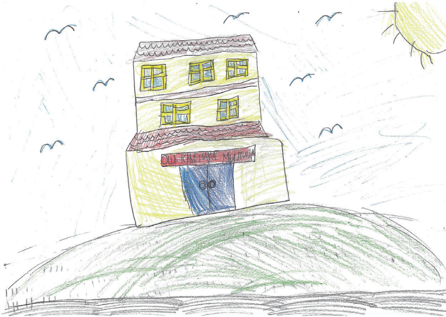
Слика 4: ОШ „Кнегиња Милица“, Исидора, 7 година.