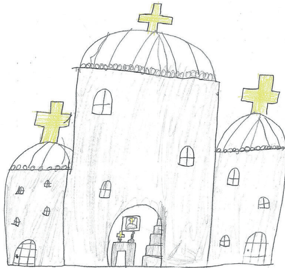
Слика 1: Храм Свештој Саве, Луна, 7 јодина.