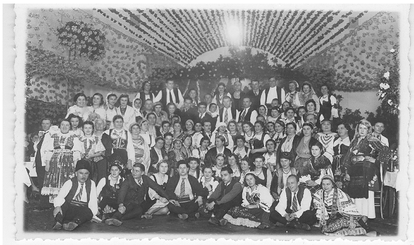
Фотографија бр. 4 – Костимирани бал у Соколани, 1939.