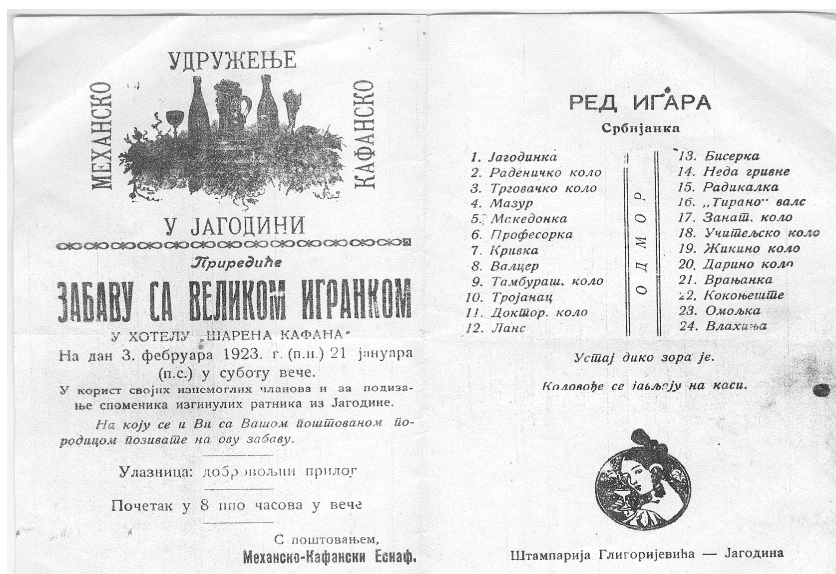
Фотографија бр. 2 – Позивница за игранку коју приређује Кафанско-механско удружење, 1923. (архив Завичајног музеја у Јагодини)