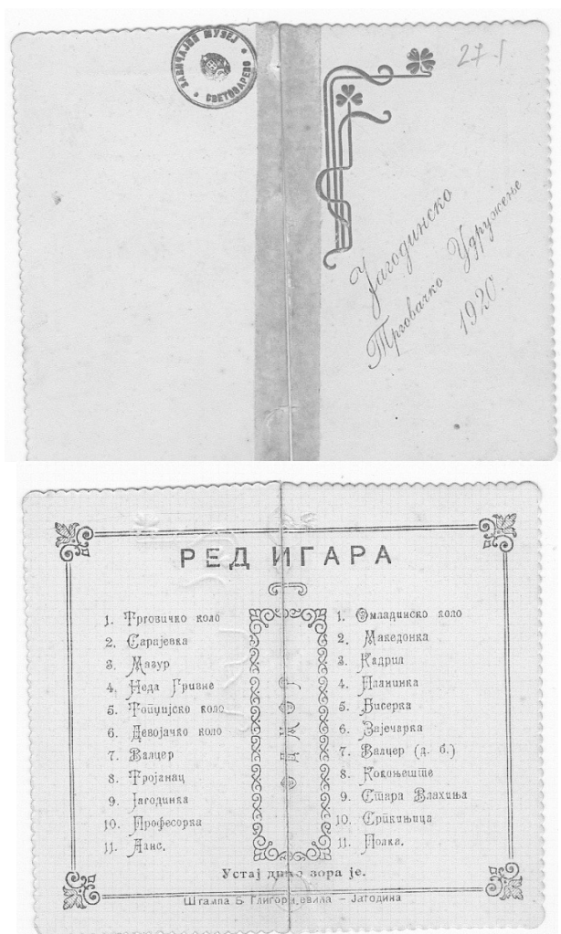
Фотографија бр. 1 – Позивница и карта са редом игара, 1920.